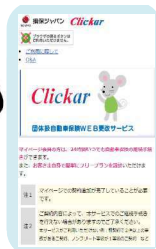
【スマホ画面イメージ】